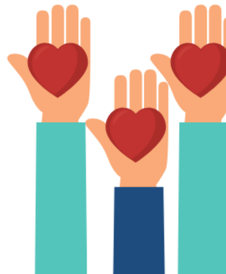
Prawo do opieki