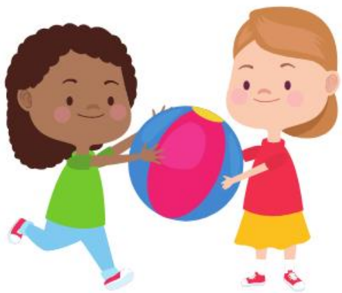
Prawo do zabawy